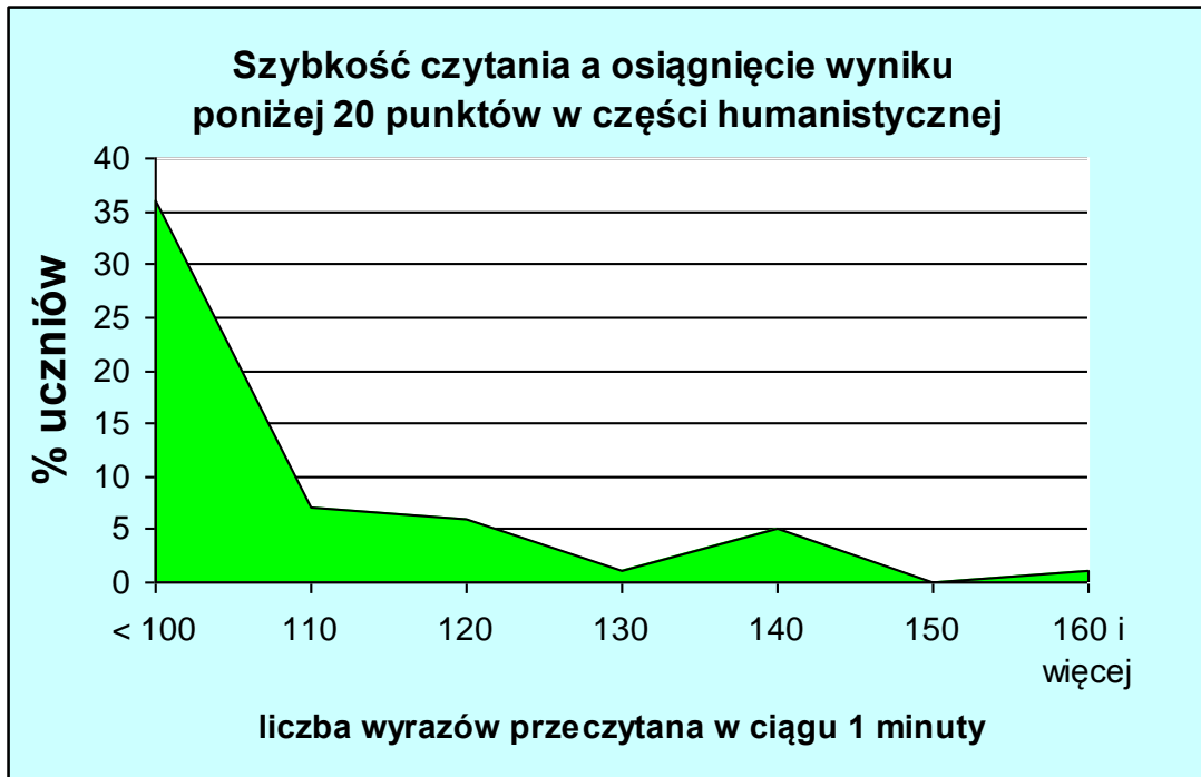
Wykres 2.

Najniższe wyniki z egzaminu uzyskują uczniowie czytający poniżej 100 wyrazów w ciągu 1 minuty. W tej grupie 81 % osiąga znacznie mniej niż 30 punktów, a 36% poniżej 20. Wśród uczniów szybciej czytających jest tylko niewielki procent uzyskujących tak niskie wyniki ( Wykres 2).