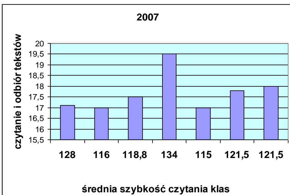
Wykres 4.

Analizując wyniki uczniów w zakresie badanych umiejętności w latach 2007 i 2008 oraz średnie szybkości czytania poszczególnych klas dostrzegłam pewne zależności. Szczególnie wyraźnie pokazują to osiągnięcia w obszarze czytanie i odbiór tekstów . Uczniowie klas, których średnia szybkości czytania wynosiła ponad 130 wyrazów na 1 minutę, uzyskały najwięcej punktów z tej części egzaminu. Tym samym zdystansowały one dość znacznie inne klasy ( Wykres 4 i 5).