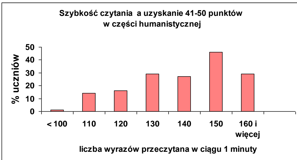
Wykres 3.

Analizując wyniki uczniów w zakresie badanych umiejętności w latach 2007 i 2008 oraz średnie szybkości czytania poszczególnych klas dostrzegłam pewne zależności. Szczególnie wyraźnie pokazują to osiągnięcia w obszarze czytanie i odbiór tekstów . Uczniowie klas, których średnia szybkości czytania wynosiła ponad 130 wyrazów na 1 minutę, uzyskały najwięcej punktów z tej części egzaminu. Tym samym zdystansowały one dość znacznie inne klasy ( Wykres 4 i 5).